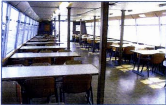
ponte di coperta