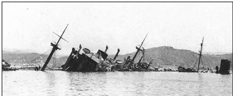
Navi affondate a La Spezia.