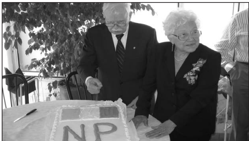
Tre momenti dell’incontro di Rimini.